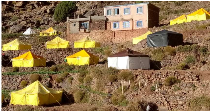
LE DOUAR IAABASSENE EN PHOTO